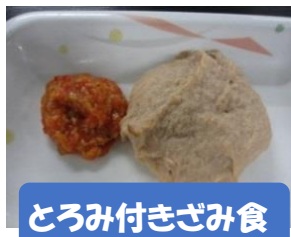
とろみ付きざみ食