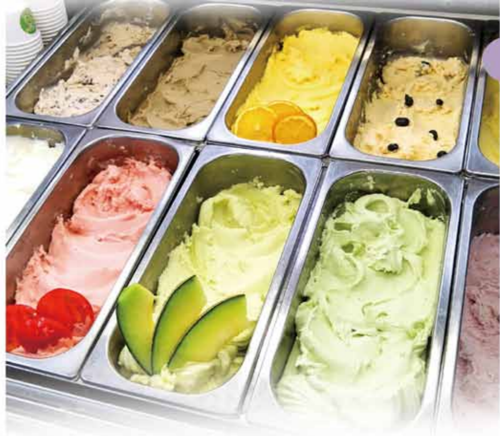
※メニューは季節により変わります

お惣菜コーナーも充実 ちらし寿司や巻きずし シンプルなみずかがみの オニギリも人気!