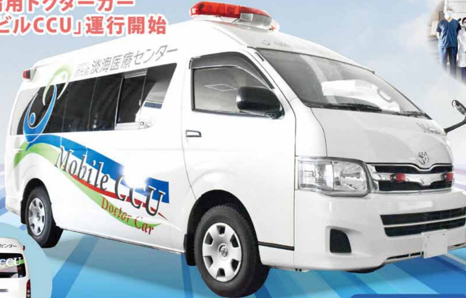
モバイルCCU Mobile Cardiovascular Care Unit

当院救急部門では2015年3月より胸痛や意識障害および心臓停止といった重症症例に対して、消防局からの直接要請によりドクターカーを派遣し現場から初期対応を開始する体制をとっています。 この体制は今後も継続していきますが、急性心筋梗塞・大動脈解離などの循環器救急疾患については当院の循環器内科専門医がドクターカー（MobileCCU）に同乗し救急現場の初期対応にあたることとなりました。