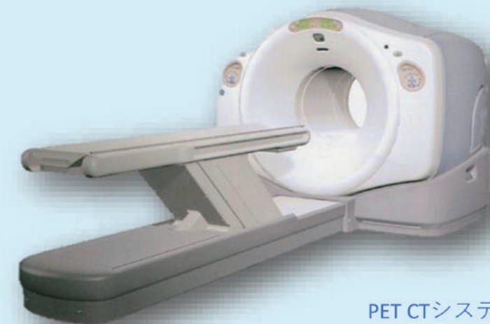
PET CTシステム Discovery ST

— Positron Emission Tomography — — Computed Tomography —